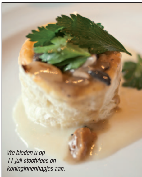
We bieden u op 11 juli stoofvlees en koninginnenhapjes aan.

Om 18 uur starten we met het feest. U wordt ontvangen met een aperitief (cava en fruitsap van de Wereldwinkel) en kan mee aanschuiven voor het eten. Dit jaar kozen we voor een warme maaltijd: stoofvlees of koninginnenhapje met brood. Er is op het terrein een frituur aanwezig voor diegenen die frietjes wensen. Ook vegetarische schotels zijn verkrijgbaar.