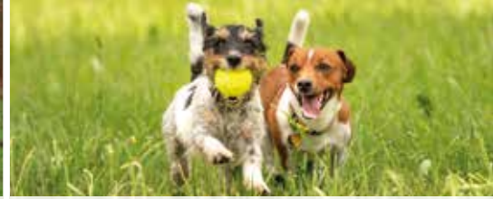
Speelbos en hondenweide op de Kievit (p. 3)