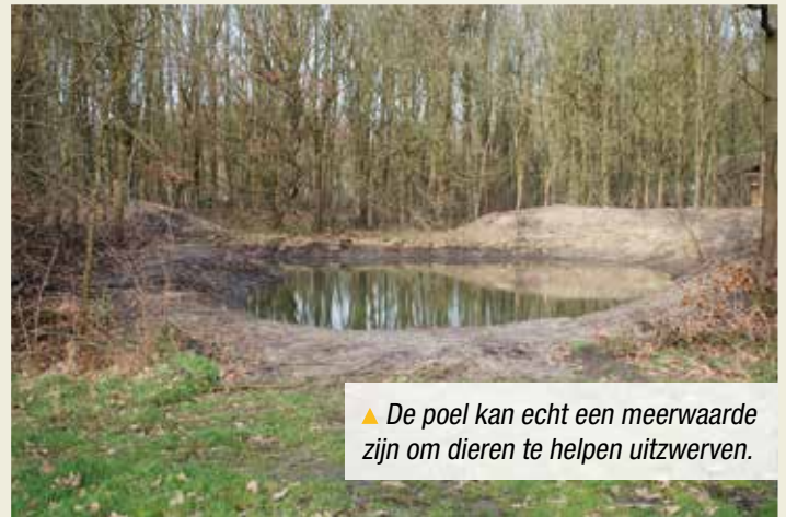
▲ De poel kan echt een meerwaarde zijn om dieren te helpen uitzwerven.

De poel kan echt een meerwaarde betekenen in het gebied en als