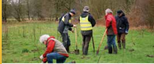
Meer bos voor het Zoerselbos (p. 2)