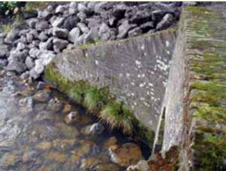
Spui Boshuisweg beschermd monument.