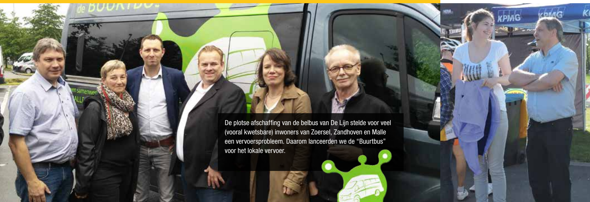
De plotse afschaffing van de belbus van De Lijn stelde voor veel (vooral kwetsbare) inwoners van Zoersel, Zandhoven en Malle een vervoersprobleem. Daarom lanceerden we de "Buurtbus" voor het lokale vervoer.