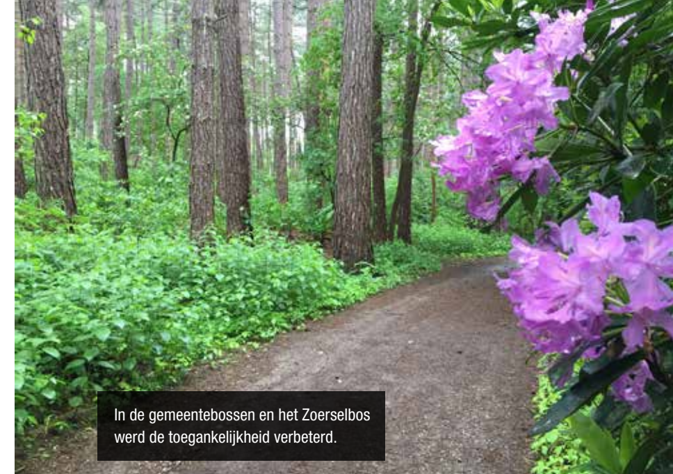
In de gemeentebossen en het Zoerselbos werd de toegankelijkheid verbeterd.

In samenwerking met JMN Voorkempen en Regionaal Landschap De Voorkempen legden we een natuurspeelpark aan tussen de Achterstraat en de Gestelsebaan. In de Dwergenbergen, 6000m 2 groot, met heuvels, speelpoelen, rietvelden en klimbomen kunnen kinderen naar hartenlust ravotten en de natuur ontdekken. Wist u dat er onlangs zelfs een driedoornige stekelbaars aangetroffen is?