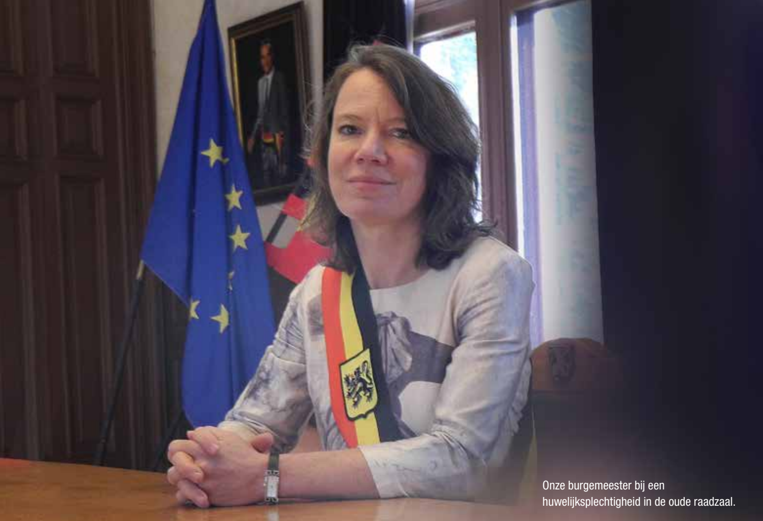
Onze burgemeester bij een huwelijksplechtigheid in de oude raadzaal.