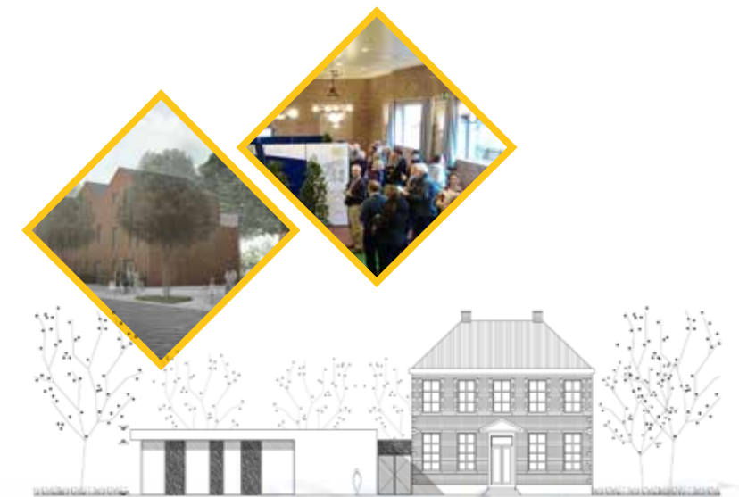
Origineel wedstrijdvoorstel Van Roey Halle-Zoersel

Aan de Lindedreef is een woonproject gepland met een mix van sociale en gewone wooneenheden. Het huidige plan voorziet in een woonerf rond een centraal groen binnenplein. Het toewijzingsreglement van de gemeente zorgt ervoor dat deze woningen eerst aan de Zoerselse gezinnen toegewezen worden.