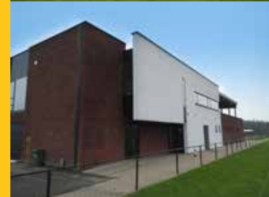
De mooie infrastructuur van KFC Zoersel kan ook door andere verenigingen gebruikt worden.

De technische dienst verhuist naar de Achterstraat waar een nieuw gebouw met kantoren en werkplaatsen zal verschijnen.