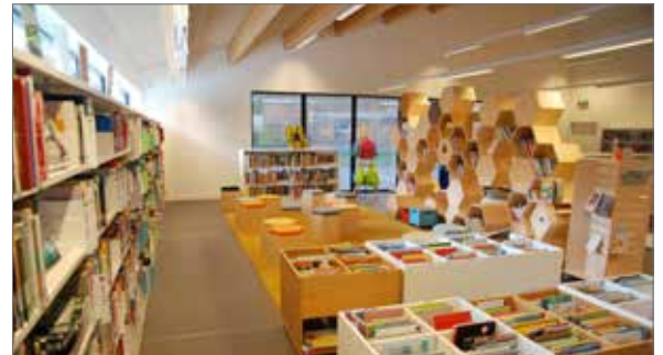
▲ Binnenkort kunt u met één uitleenkaart terecht in de bibliotheken van Borsbeek, Malle, Ranst, Wijnegem, Wommelgem, Zandhoven en Zoersel.

Door samen te werken kunnen de bibliotheken onder meer hun collecties op elkaar afstemmen, wisselcollecties, anderstalige boeken en grootletterboeken aanbieden en grotere activiteiten organiseren voor de lezers. Bibburen is een mooi initiatief waar de lezer wel bij vaart.