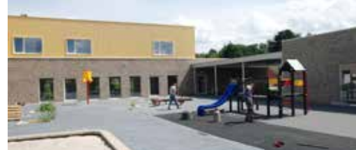
Kinderen starten in gloednieuwe school p. 3