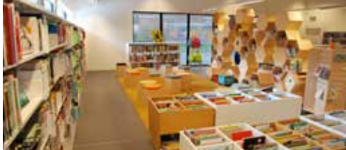
Betere dienstverlening dankzij Bibburen p. 2